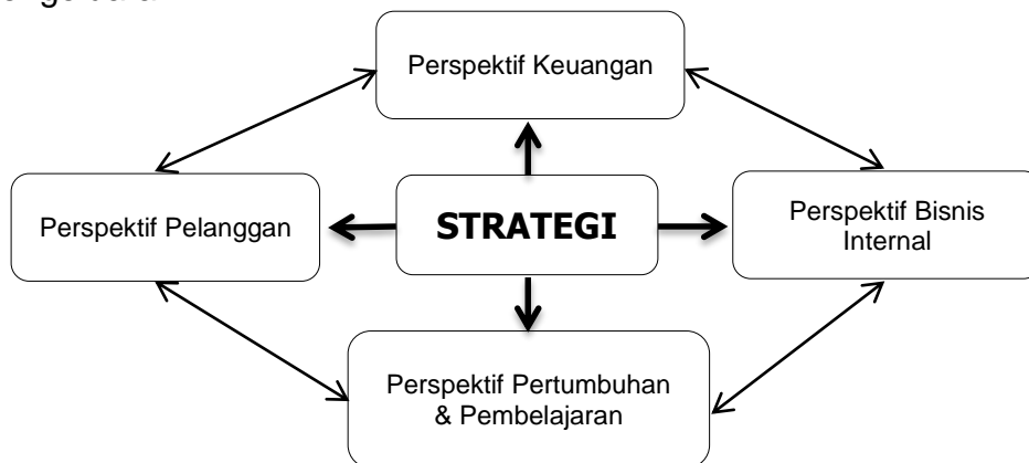
Gambar 3.1. Perspektif dalam Balanced Scorecard

Finansial berperan sebagai fokus bagi tujuan-tujuan strategis dan ukuran-ukuran semua perspektif dalam Balanced Scorecard . Setiap ukuran yang dipilih seyogyanya menjadi bagian dari suatu keterkaitan hubungan sebab-akibat yang memuncak pada peningkatan kinerja finansial. Kinerja lembaga pendidikan Islam dinilai dari sisi financial oleh stakeholdernya yang secara umum terdiri dari dua hal yaitu maksimalisasi penerimaan dan efisiensi pengeluaran.