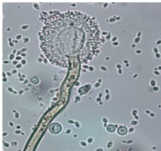
Gambar 3. Penampakan mikroskopik Rhodotorula sp. UICC Y-332 dengan A. terreus pada medium PDB

Hasil co-culture menunjukkan diantara enam strain Rhodotorula spp., Rhodotorula sp. UICC Y-332 mempunyai kemampuan terbesar dalam mereduksi diameter kepala konidia A. terreus . Rhodotorula sp. UICC Y-332 dapat mereduksi ukuran diameter kepala konidia A. terreus pada hari ke-2 dan ke-3 secara berurutan sebesar 10,17% dan 9,60% tetapi tidak dapat mereduksi lebar hifa kapang (Tabel 2).