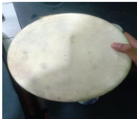
Tifa Cincang Atas