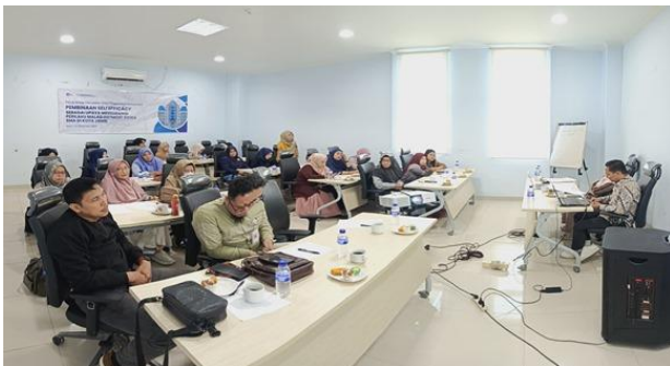
Gambar 3: Suasana workshop kolaboratif pengembangan modul pembinaan self-efficacy

Para peserta juga menyepakati beberapa metode pembelajaran yang dianggap efektif untuk program pembinaan self-efficacy , termasuk role-playing, simulasi, dan sistem pemberian umpan balik positif. Metode-metode ini dipilih karena dinilai mampu memberikan pengalaman langsung kepada siswa dan membantu mereka mengembangkan keterampilan praktis dalam meningkatkan self-efficacy mereka. Selain itu, peserta juga melakukan penyesuaian materi modul agar lebih relevan dengan kondisi dan karakteristik siswa di Kota Jambi, memastikan bahwa program yang dikembangkan benar-benar dapat diimplementasikan secara efektif di lapangan.