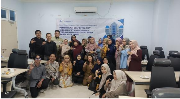
Gambar 4: Foto bersama setelah kegiatan workshop kolaboratif

Pengembangan modul pembinaan self-efficacy melalui proses FGD dengan guru BK mencerminkan pemahaman bahwa intervensi harus mempertimbangkan konteks lokal dan kebutuhan spesifik siswa. Pendekatan ini sesuai dengan pandangan Gerungan (2004) yang menekankan bahwa manusia selalu berusaha beradaptasi dengan lingkungannya, dan agar interaksi dapat berjalan, remaja diharapkan mampu beradaptasi secara khusus dengan lingkungan sosialnya. Modul yang dikembangkan mempertimbangkan berbagai aspek penyesuaian diri siswa, sejalan dengan temuan Suryani (2013) tentang kesulitan remaja dalam menyesuaikan diri pada perubahan psikologisnya.