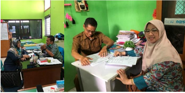
Gambar 2: Suasana FGD ke sekolah-sekolah SMAN di Kota Jambi

Untuk mengoptimalkan efisiensi waktu dan sumber daya, tim PkM dibagi menjadi dua kelompok yang bertugas mengunjungi sekolah-sekolah yang telah dipetakan sebelumnya. Setiap kunjungan sekolah diawali dengan sesi perkenalan dan pengantar dari tim pengabdian, yang kemudian dilanjutkan dengan pembentukan kelompok-kelompok diskusi yang terdiri dari guru BK, perwakilan siswa, dan pihak manajemen sekolah. Pendekatan ini memungkinkan terciptanya dialog yang komprehensif dan mendalam mengenai berbagai aspek perilaku maladjustment yang terjadi di lingkungan sekolah.