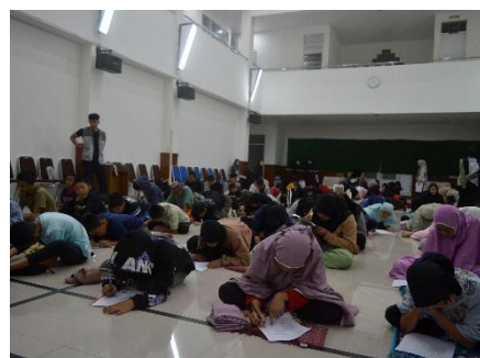
Gambar 1. Screening awal