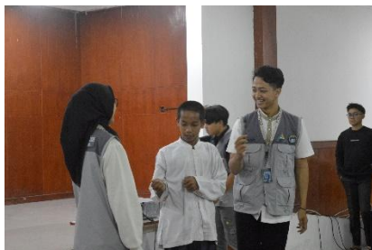
Gambar 3. Diskusi dan refleksi