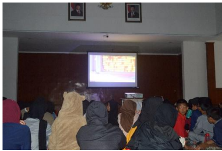
Gambar 2. Pemutaran film