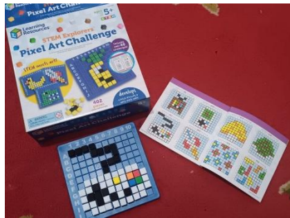
Gambar 2. Mainan impor untuk melakukan aktivitas steam pixel art