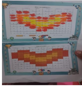
Gambar. 1 pixel art menggunakan kertas

Pada gambar 1, siswa dapat menggambar secara manual dengan warna yang disukai sesuai dengan pola dan urutan yang kemudian dapat menghasilkan. Berbagai pola dan urutan dari steam ini yang melatih anak usia dini dengan baik.