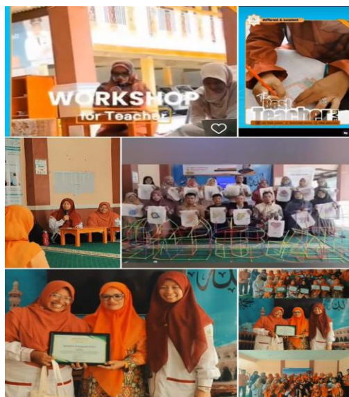
Gambar 3. Aktivitas guru dalam melaksanakan STEAM pixel art

Pelaksanaan dilakukan oleh beberapa orang praktisi yang memberikan materi dan pelatihan kepada guru guru. Berikut gambar 3 merupakan Kumpulan gambar dalam satu frame untuk memvisualisasikan proses aktivitas steam pixel art pada guru.