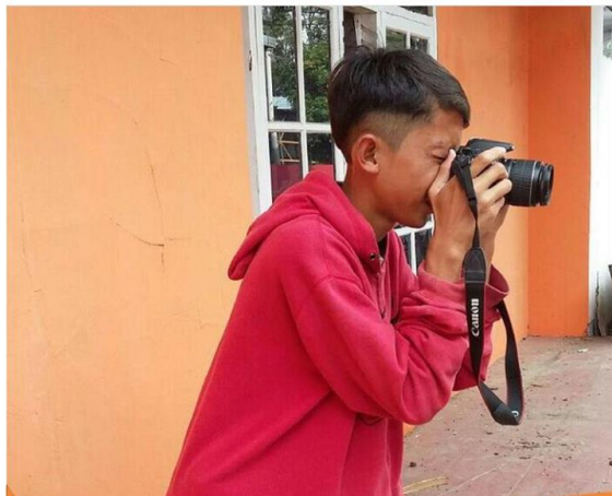
Gambar 8. Fotografi