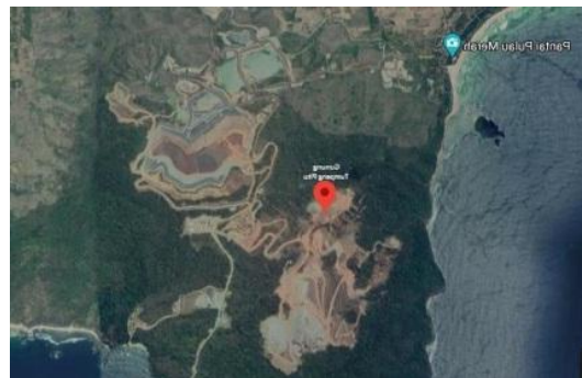
Gambar 2: kondisi pengundulan gunung Tumpang Pitu dari Satelit

Hal ini menunjukkan bahwa dokumen pasca pertambangan yang mewajibkan adanya kompensasi tukar tambah lahan tambang emas Tumpang Pitu tidak dapat dirasakan manfaatnya oleh masyarakat di sekitar Tumpang Pitu. Hal ini dikarenakan kompensasi tukar tambah lahan tersebut berada di luar Kabupaten Banyuwangi, sebagaimana disampaikan oleh Budi Wahono selaku Kepala Bidang Pertambangan, Perindagtam, Kabupaten Banyuwangi di atas. Hal ini ditambah dengan fakta bahwa waktu tunggu hutan yang dieksploitasi untuk tumbuh kembali akan sangat lama. Oleh karena itu, pemberian kompensasi lahan pengganti tidak akan memperbaiki kerusakan lingkungan akibat tambang emas Tumpang Pitu di Kabupaten Banyuwangi.