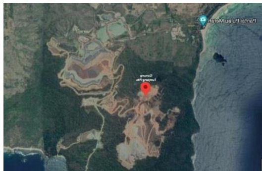
Gambar 2: kondisi pengundulan gunung Tumpang Pitu dari Satelit

Hal ini menunjukkan bahwa dokumen pasca pertambangan yang mewajibkan adanya kompensasi tukar tambah lahan tambang emas Tumpang Pitu tidak dapat dirasakan manfaatnya oleh masyarakat di sekitar Tumpang Pitu. Hal ini dikarenakan kompensasi tukar tambah lahan tersebut berada di luar Kabupaten Banyuwangi, sebagaimana disampaikan oleh Budi Wahono selaku Kepala Bidang Pertambangan, Perindagtam, Kabupaten Banyuwangi di atas. Hal ini ditambah dengan fakta bahwa waktu tunggu hutan yang dieksploitasi untuk tumbuh kembali akan sangat lama. Oleh karena itu, pemberian kompensasi lahan pengganti tidak akan memperbaiki kerusakan lingkungan akibat tambang emas Tumpang Pitu di Kabupaten Banyuwangi.