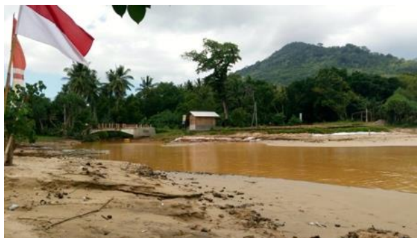
Gambar 4: Kondisi Muara Pantai Pulau Merah

Penurunan hasil tangkapan para nelayan saat melaut dapat dikalkulasi dan dipahami dari data yang telah dijelaskan oleh BPS (Badan Pusat Statistik) Kabupaten Banyuwangi. BPS menjelaskan bahwa khusus di Kecamatan Pesanggaran sebagai lokasi tambang emas Tumpang Pitu, produksi ikan tangkapan mengalami penurunan yang sangat drastis dari tahun 2018-2020. 53