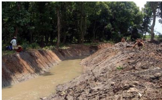
Gambar 6: Keadaan Sungai Gonggo di sekitar Gunung Tumpang Pitu yang

Menurut Rahmat, hal ini karena aliran air sungai selebar 5 meter tersebut ditampung oleh PT. BSI selaku pihak pengelola tambang emas Tumpang Pitu untuk dialirkan ke sebuah tabung sepanjang kurang lebih 5 km. Dengan 6 penyedot cangkir hisap, air mengalir secara maraton untuk memenuhi kebutuhan air saat proses eksplorasi di tambang emas. Menurut Rahmat, Aliran air tersebut dijaga dan dikontrol langsung oleh para penjaga dari PT. BSI. 54