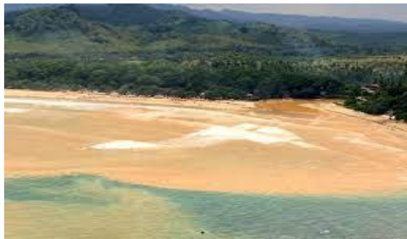
Gambar 3 : Kondisi Pantai Pulau Merah yang tercemari limbah

Penjelasan para nelayan di atas diperkuat dengan bukti ilmiah dari para ilmuwan yang menjelaskan bahwa limbah hasil produksi tambang dapat merusak terumbu karang yang pada akhirnya menyebabkan hilangnya ekosistem biota laut di dalamnya. 52 Berikut penulis sertakan dokumentasi yang didapat dari wawancara dengan masyarakat sekitar gunung Tumpang Pitu dan observasi di sekitar Pantai Pulau Merah yang terletak di samping pertambangan emas.