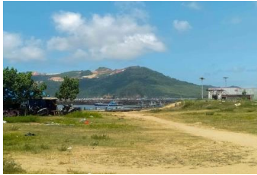
Gambar 1: kondisi pengudulan Gunung Tumpang Pitu