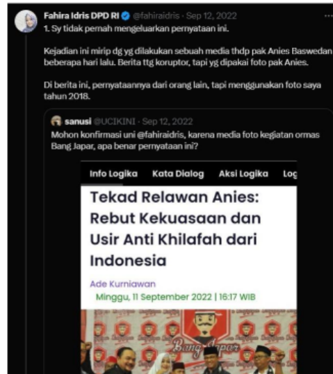
Gambar 5. Konfirmasi Hoax Pemberitaan Radikalisme Pendukung Anies

bulan atau lama waktu penelitian ini dilakukan, dan latar berita online tersebut diunggah melalui 6 situs dengan konten berita yang sama, yakni (Kurniawan, 2022c), (Zulia, 2022), (Kurniawan, 2022b), (Anonim, 2022), (Heryanto, 2022), (Agn, 2022). Kendati demikian, berita online yang diunggah oleh 6 situs tersebut terindikasi hoax dan dikomentari oleh akun resmi dari salah seorang yang ada dalam foto pemberitaan tersebut: