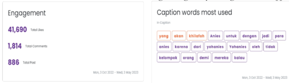
Gambar 7. Total Interaksi dan Kata Yang Paling Banyak Digunakan Buzzer

simulakra identitas Anies Baswedan dengan menciptakan interaksi 43.504 sejak 03 september 2022 hingga 03 mei 2023 dengan rincian interaksi sebagai berikut: