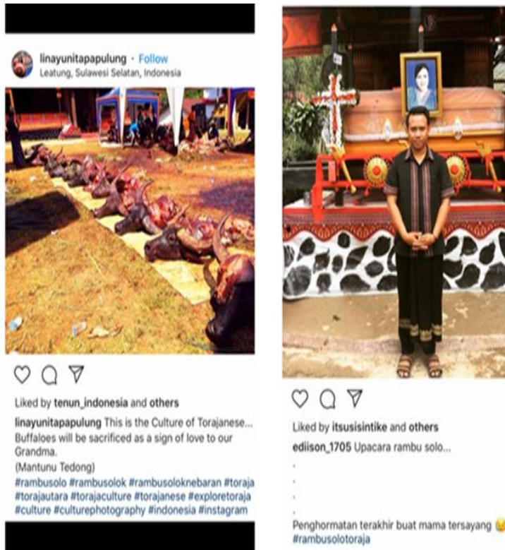
Gambar 8. Belasan kepala kerbau yang disembelih dalam ritual Rambu Solo

menunjukkan dua unggahan, yakni akun @linayunitapapulung dan @ediison_1705.