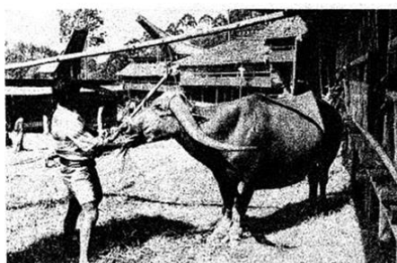
DISUAPI — Kerbau belian (beliri) yang tanduknya hampir semeter, disuapi dengan paku kawat sayung oleh laki-laki Toraja. Kerbau demikian terhitung paling tinggi nilainya dalam upacara kerbau bagi orang mati.

menyuguhkan kemegahan dan mahalnnya penyelenggaraan ritual pemakaman ini, tetapi juga menyajikan unsur-unsur penyelenggaraan ritual ini. Sebagaimana dikemukakan di bagian sebelumnya bahwa salah satu unsur utama dalam ritual Rambu Solo adalah persembahan beberapa ekor kerbau yang dimaknai sebagai “tunggangan” yang akan mengantarkan arwah menuju puya sehingga perlakuan istimewa orang-orang Toraja terhadap kerbau menjadi salah satu unsur yang diangkat dalam pemberitaan media massa. Pada Gambar 3 tampak sebuah berita dengan narasi tentang keistimewaan hewan yang lazim digunakan sebagai pembajak sawah ini. Media massa menggunakan kata “dimanja” untuk menggambarkan perlakuan istimewa orang Toraja terhadap kerbau yang akan dijadikan sebagai persembahan dalam ritual Rambu Solo.