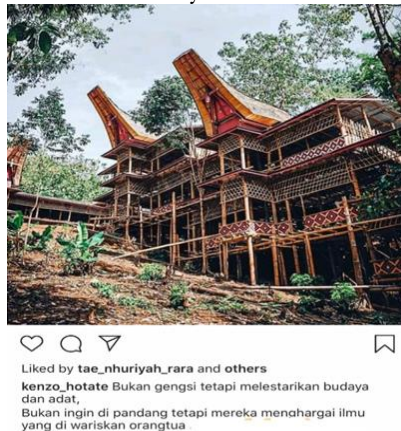
Gambar 4. Persiapan ritual Rambu Solo

Melalui Instagram, generasi muda Toraja mengungkapkan sudut pandangnya mengenai praktik ritual Rambu Solo mewah berbagai macam cara, namun secara umum mereka menarasikan kembali wacana-wacana hegemonik yang dahulu diproduksi oleh para elite untuk membela praktik ritual Rambu Solo di mana mereka juga terlibat di dalamnya.