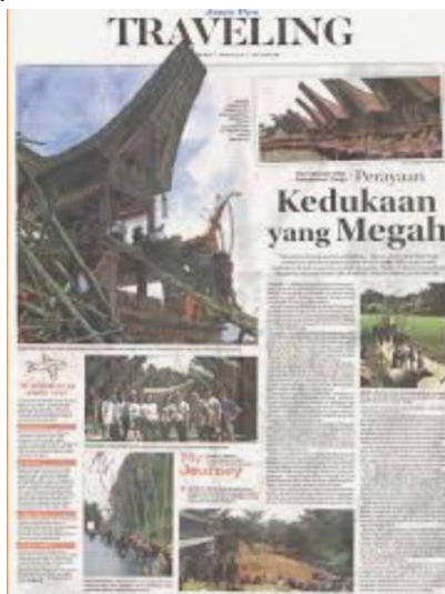
Gambar 2. “Kedukaan yang Megah”

Narasi tentang mahalnya biaya pemakaman secara psikologis mengimplikasikan bahwa ritual pernikahan semestinya lebih penting dari ritual pemakaman dan lebih masuk akal jika membutuhkan biaya yang lebih besar. Namun media tidak mengungkapkan bahwa hal ini sebagai sesuatu yang lumrah bagi orang Toraja sebagai adat yang telah dijalankan secara turun-temurun. Narasi dalam pemberitaan ini secara tidak langsung juga telah menggaungkan hegemoni ritual ini agar diketahui oleh publik secara lebih luas. Namun demikian, yang lepas dari pemberitaan ini adalah media massa adalah makna-makna simbolik dari ritual itu secara keseluruhan. Narasi senada juga muncul pada media massa lainnya yang masih menyinggung penyelenggaraan ritual Rambu Solo sebagai bentuk kedukaan yang megah sebagaimana diperlihatkan pada Gambar 2 berikut.