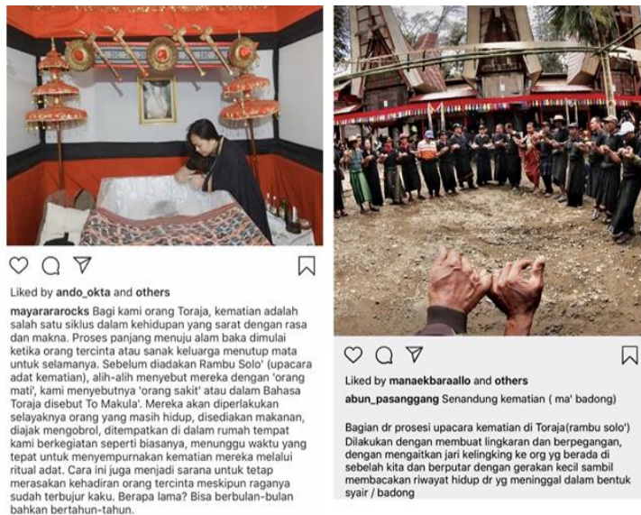
Gambar 9. Menunggu jenazah orangtuanya yang sudah meninggal

Dengan cara yang sama, beberapa akun lainnya juga memperlihatkan hal yang serupa sebagaimana dapat dilihat pada Gambar 9.