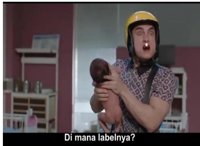
Gambar 8. PK menanyakan label agama pada bayi