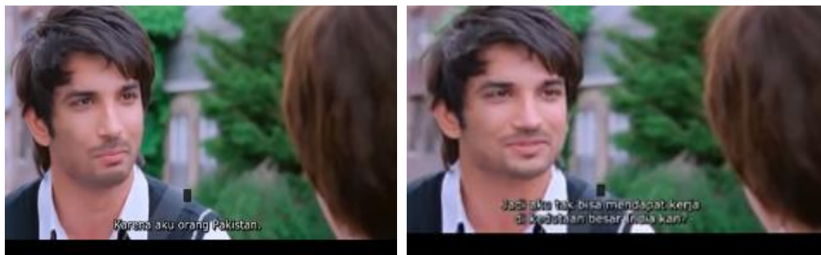
Gambar 2. Warga Pakistan dilarang bekerja di India