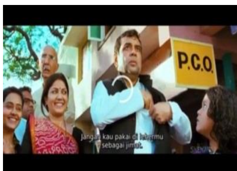
Gambar 10. Melarang memakai jimat