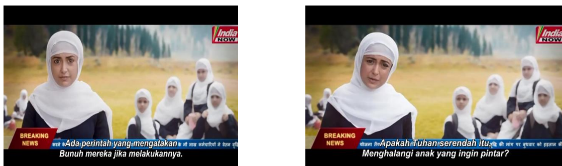
Gambar 4. Diskriminasi perempuan dalam agama