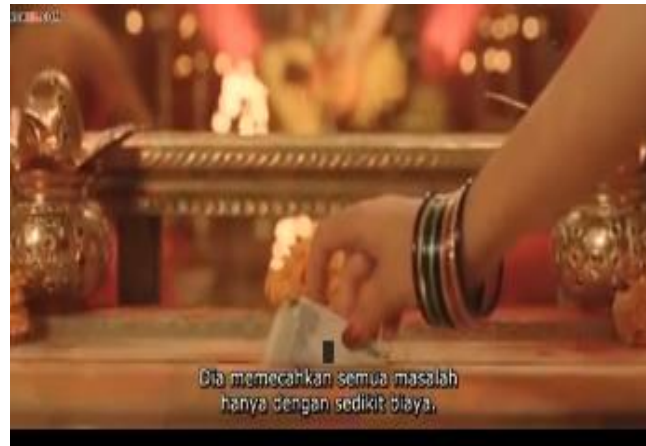
Gambar 1. Seseorang memasukkan uang ke sebuah kotak amal untuk memecahkan masalah