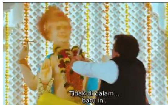
Gambar 7. Khanji menghancurkan patung dewa Khanji