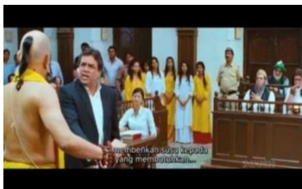
Gambar 9. Ritual pemberian susu