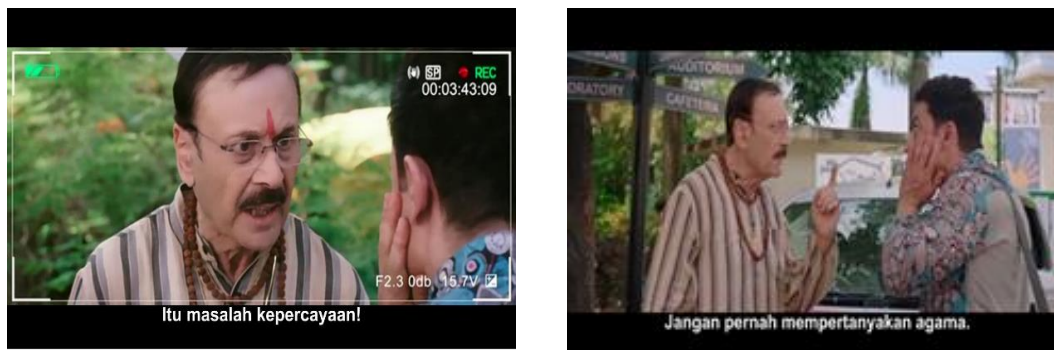
Gambar 3. Pekeey ditampar karena mengkritik batu Siwa