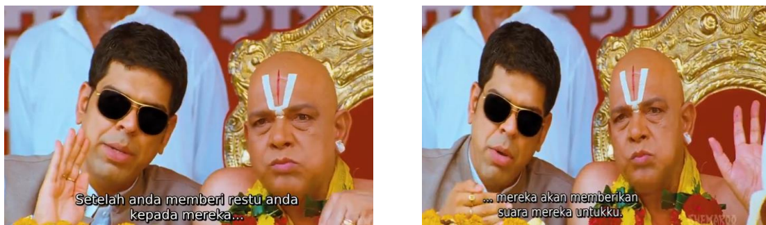
Gambar 6. Pendeta diundang dalam acara kampanye Mishra : anda memberi restu anda kepada mereka, mereka akan memberikan suara mereka untukku.