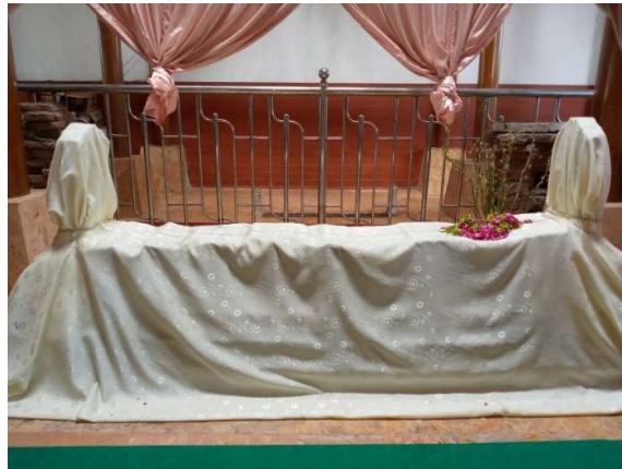
Foto 6. Jirat dan nisan makam Syekh Syamsuddin Al-Wasil

terutama dalam bidang perdagangan. 39 Hal tersebut mengakibatkan arsitektur makam yang dibuat mirip dengan bangunan era Hindu-Budha. Selain itu, pembuatan motif yang mirip dimaksudkan sebagai salah satu jalan dakwah untuk menarik simpati masyarakat yang belum masuk Islam.