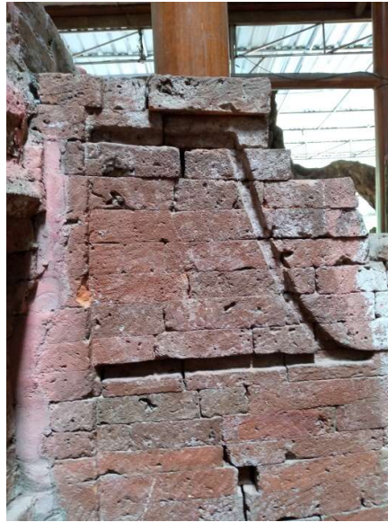
Foto 2. Motif hias sayap pada gapura padhuraksa pertama (Dokumentasi pribadi, 07 Juni 2022)

(Musyawarah Burung). Dalam Mantiq al-Tayr , roh manusia yang mencari asal-usul manusia itu sendiri dan ketuhanannya dilambangkan sebagai burung-burung yang melakukan perjalanan. Dalam perjalanan ini, cinta terletak pada lembah (kedudukan) kedua dari tujuh tingkatan lembah yang harus dilewati agar bisa menemui maharaja mereka (Simurgh), yang melambangkan hakekat ketuhanan dan hakekat manusia. 32