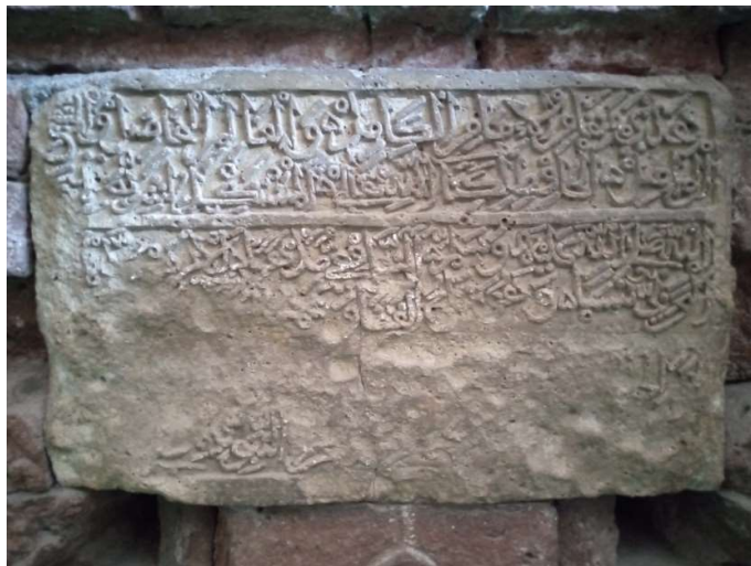
Foto 7. Inskripsi pada dinding keliling kedua makam Syekh Syamsuddin Al-Wasil (Dokumentasi pribadi, 23 Januari 2022)