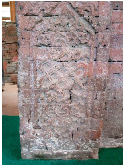
Foto 5. Motif hias jalinan bunga teratai pada salah satu sisi gapura padhuraksa kedua (Dokumentasi pribadi, 23 Januari 2022)

Penggunaan motif teratai maupun bunga matahari diaplikasikan pada makam-makam Islam karena motif-motif tersebut dianggap yang tidak melanggar norma dalam Islam. Terjadi banyak perdebatan di kalangan para ulama mengenai penggambaran makhluk bernyawa (tashwir). Pelarangan dalam penggambaran