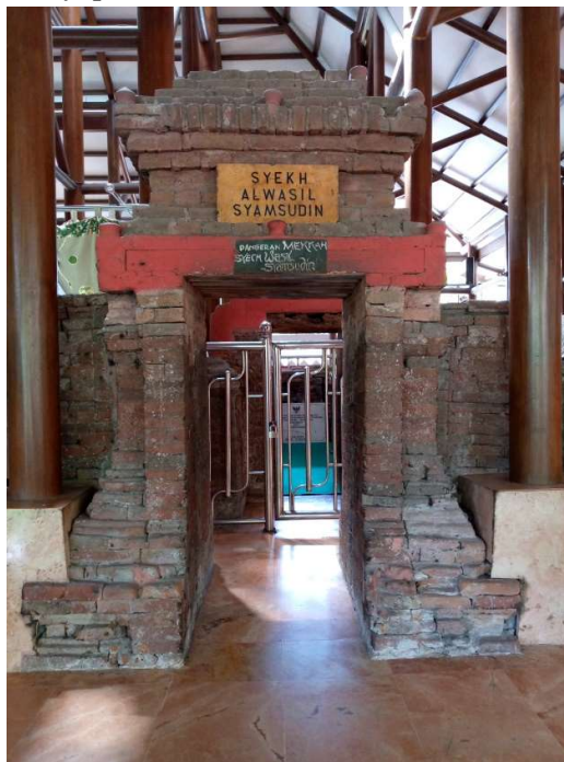
Foto 1. Gapura Padhuraksa pertama pada cungkup makam Syekh Syamsuddin Al-Wasil (07 Juni 2022)

Pada makam Syekh Syamsuddin Al-Wasil terdapat dua gapura. Bagian gapura paduraksa hingga saat ini masih asli, hanya saja pada bagian atap sudah diganti dengan yang baru. Gapura pertama memiliki tinggi 2,5 meter, panjang 1,86 meter dengan lebar 1,15 meter serta lebar lorong gapura 70 cm. Kedua bagian kanan kiri gapura dihiasi motif sayap. 30