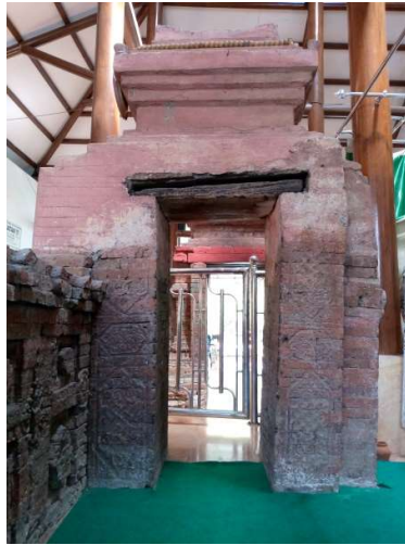
Foto 3. Gapura padhuraksa kedua pada cungkup makam Syekh Syamsuddin Al-Wasil, tampak dari dalam.