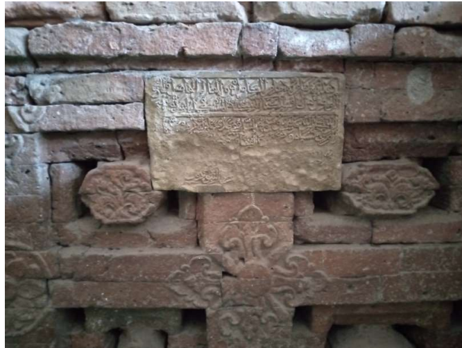
Foto 7. Inskripsi pada dinding keliling kedua makam Syekh Syamsuddin Al-Wasil (Dokumentasi pribadi, 23 Januari 2022)

f. ....sembilan ratus (?) dua puluh (?).....hijrah Nabi..... 41