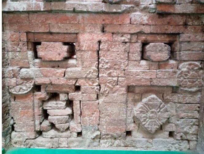
Foto 4. Motif bunga teratai dan bunga matahari pada dinding keliling kedua makam Syekh Syamsuddin Al-Wasil (Dokumentasi pribadi, 23 Januari 2022)

bunga matahari ini terdapat pada bagian dinding gapura kedua dan kedua dinding keliling makam. Pada agama Islam, teratai juga sudah seringkali digunakan, seperti pada dinding cungkup makam Sunan Drajat.