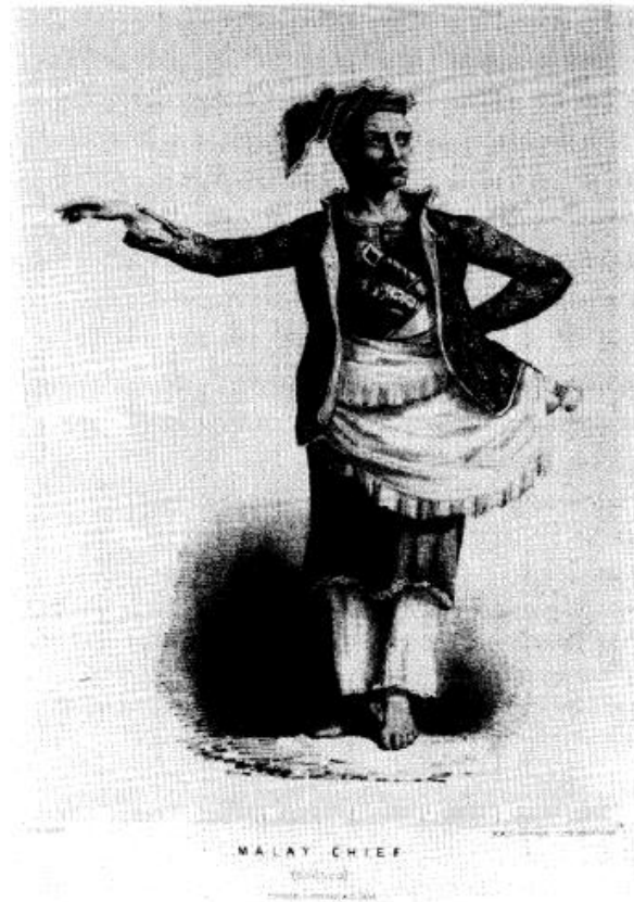
Gambar 2. Datu Tausug yang mengatur perdagangan budak sekitar 1840-an