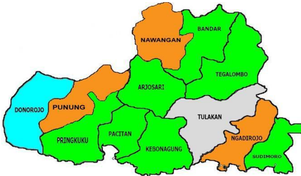
Gambar 2. Hasil Rescalling potensi bahan pangan Kabupaten Pacitan

sebagai daerah penghasil bahan pangan secara keseluruhan. Namun, ubi jalar juga dapat dikembangkan berdasarkan hasil scalling dan rescalling. Hal tersebut dikarenakan tanaman ubi jalar memiliki nilai interval lebih dari 40% (prioritas) baik dari hasil scalling maupun rescalling.