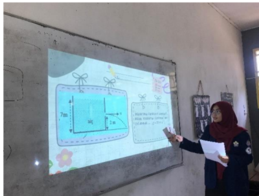
Gambar 3. Penggunaan Canva pada pengajaran

dari pada pembelajaran biasa menggunakan alat konvensional.