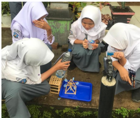
Gambar 2. Uji proyek kincir air sederhana

yang terkait dengan produk yang dihasilkan. Dari proses pembelajaran yang telah dilaksanakan dapat dilihat bahwa project based learning dapat mempengaruhi kemampuan berpikir kritis siswa.