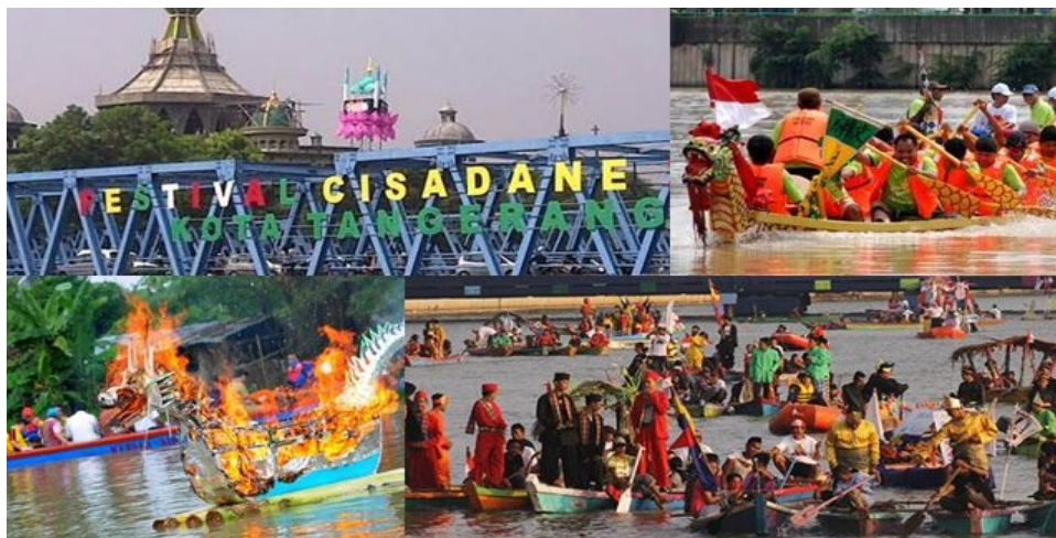
Gambar 1 Kegiatan Berbudaya