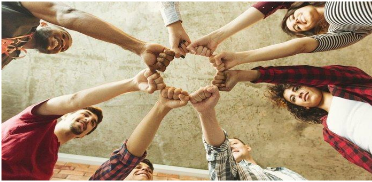
(ilustrasi berjanji untuk saling menghormati perbedaan)

Setiap orang memiliki cara berpikirnya masing-masing yang tentunya berbeda satu sama lain. Jangankan dalam penyelesaian proses belajar, dalam kehidupan sehari-hari pasti ada perbedaan yang menimbulkan suatu masalah. Nah, untuk menghindari hal tersebut anda harus berjanji dan harus menciptakan suasana saling menghargai perbedaan yang ada di antara kalian.