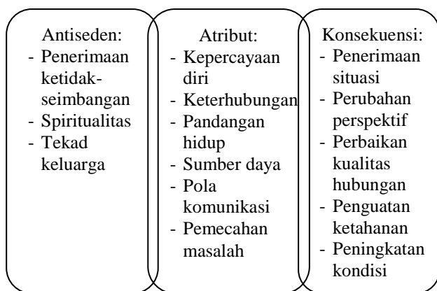
Gambar 3. Anteseden, atribut, dan konsekuensi ketahanan keluarga

Ketahanan keluarga merupakan konsep yang kompleks. Karena itu, para ahli pada umumnya lebih memandang ketahanan ini sebagai suatu proses, bukan semata atribut konstitusional yang tetap, yang dipengaruhi oleh berbagai kondisi keseharian yang ditemui dalam pengalaman hidup bersama sebagai seorang individu atau dalam sebuah komunitas sosial tertentu seperti keluarga. Berdasarkan pandangan seperti ini pula, ketahanan kemudian dapat dikonsepsikan sebagai mekanisme protektif yang memodifikasi respons individu terhadap berbagai situasi yang berisiko dan berlaku pada titik kritis dalam kehidupan seseorang.