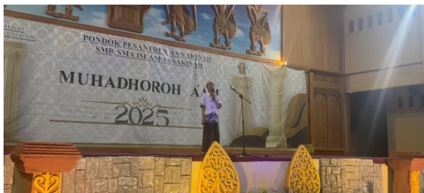
Gambar 2. Kegiatan Muhadharah

mempraktikkan kosakata dan pola kalimat yang telah dipelajari melalui percakapan berpasangan atau kelompok kecil dalam atmosfer yang lebih santai.