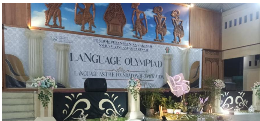
Gambar 3. Kegiatan 'Language Olympiad'

Kegiatan tahunan bertajuk Language Olympiad juga tercatat sebagai bagian dari penerapan pembelajaran di luar kelas. Dokumentasi foto pada Gambar 3 memperlihatkan pelaksanaan acara tersebut, yang memuat berbagai perlombaan seperti drama, pidato, dan pembacaan puisi dalam bahasa Arab dengan melibatkan santri dari berbagai tingkatan. Berdasarkan catatan observasi dan keterangan koordinator program, kegiatan-kegiatan ini dimaksudkan untuk mentransformasikan materi dan hafalan di kelas menjadi pengalaman berbahasa yang bersifat performatif, meskipun partisipasi yang sangat aktif dalam tampil di depan umum masih cenderung berasal dari sebagian santri yang lebih percaya diri.