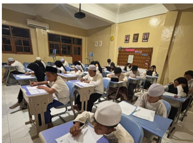
Gambar 1. Kegiatan Pembelajaran di dalam Kelas

Pelaksanaan Muhadatsah di kelas difokuskan pada latihan percakapan menggunakan bahasa Arab sebagai bahasa utama interaksi. Pengajar mengawali kegiatan dengan pengenalan ungkapan-ungkapan yang relevan dengan kehidupan santri, kemudian mengarahkan santri untuk berlatih dialog berpasangan, diskusi kelompok kecil, dan presentasi singkat di depan kelas. Gambar 1 mendokumentasikan suasana salah satu sesi pembelajaran di kelas, di mana pengajar berdiri di depan kelas menjelaskan materi lalu dilanjutkan memberikan latihan sementara santri memperhatikan dan mengerjakan latihan yang diberikan di meja masing-masing. Secara umum, observasi menunjukkan bahwa penggunaan bahasa Arab oleh pengajar cukup intensif, sedangkan penggunaan bahasa Arab oleh santri masih bervariasi antar individu dan antar mata pelajaran.