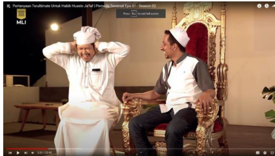
Gambar 3. Gerakan saat mengucapkan tagline pemuda tersesat

mencair dan non-formal sehingga penonton yang melihat tidak membosankan. Pemilihan segmentasi yang lebih mengerah kepada pemuda sangat cocok sehingga hanya dalam beberapa waktu sebentar saja sudah ramai. Keberhasilan ini menjadikan dakwah dinilai sebagai komoditas yang dapat di komodifikasi sehingga menjadikannya lebih menjual.